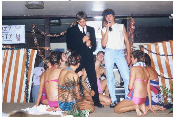
Een zingende Luc Van Lierde