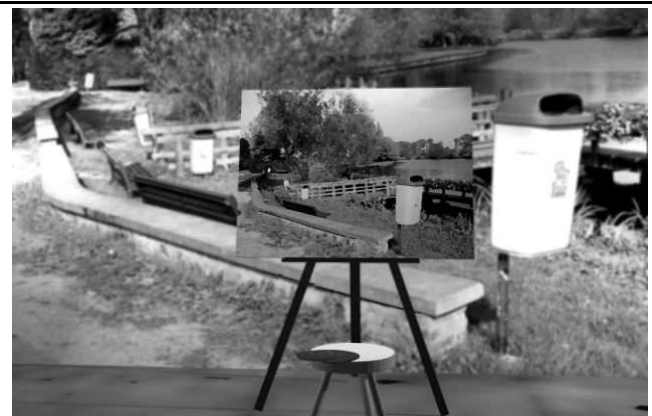
Leiesteiger opnieuw gegeerd door schildersvolkje

Ik zal steeds een volksjongen blijven en de dag dat dit soort schuinschrijverij niet meer getole-reerd wordt, mag de wereld vergaan. Ik zeg het een laatste maal: het is de bedoeling commen-taar en polemieken uit te lokken. Om die te publiceren in dit pamflet ontbreekt de plaats, maar de criticasters krijgen een wereldwijd forum op het internet, waar hun commentaar te grabbel komt op de weblog van dit blad. Recht van spreken, recht van antwoord! Zo moet het.